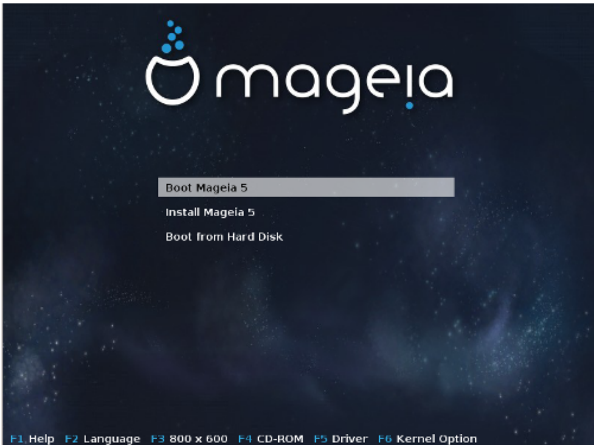
Eerste scherm na starten in BIOS-modus

In het middelste menu, heeft u de keuze tussen drie acties: